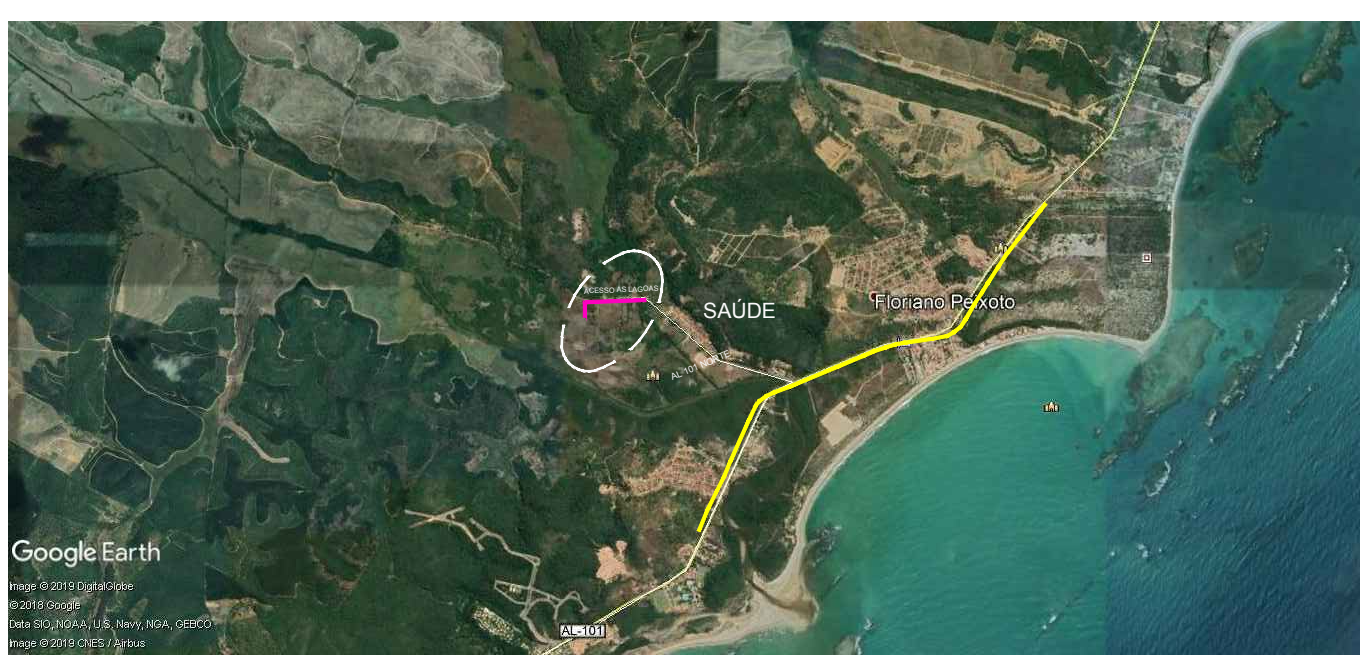
PLANTA DE SITUAÇÃO SEM ESC.