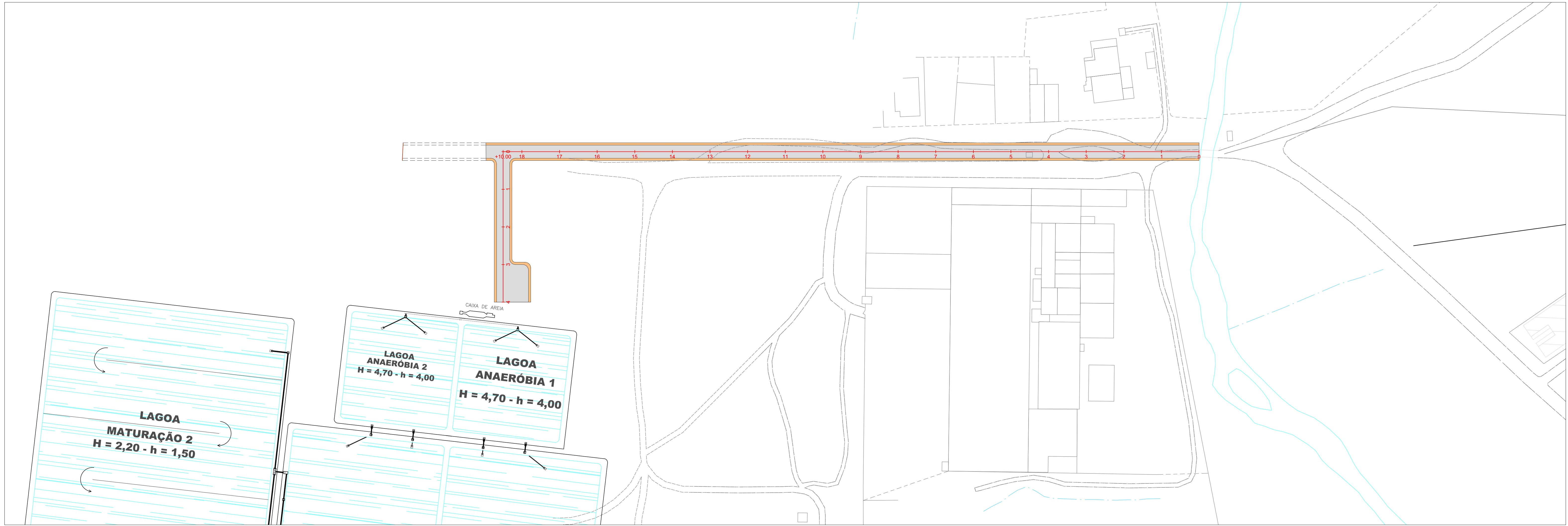
PLANTA DE LOCALIZAÇÃO ESC: 1/1000